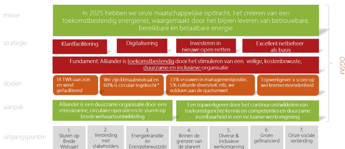
Figuur; Maatschappelijk Verantwoord Ondernemen in het Bestuursmodel Alliander, 2021 - 2025

Ons CO 2 programma is onderdeel van onze MVO-strategie voor Maatschappelijk Verantwoord Ondernemen. Deze is volledig geïntegreerd in de besturing van onze organisatie.